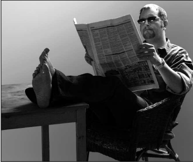
Aus Zeitungstexten wird Musik – Seite 4