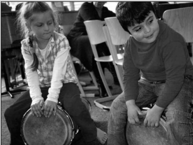
Die Laborschule Bielefeld stellt Erfahrungen und Ergebnisse vor – Seite 16