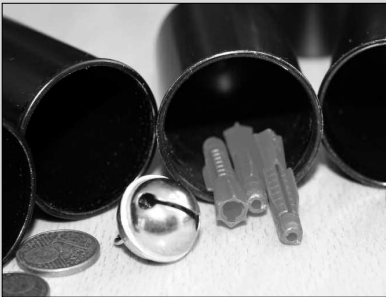
Kleine Experimente zur Schulung von Klangerkennung, Konzentration und Vorstellungsvermögen – Seite 6