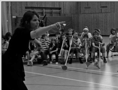
Soundpainting – Seite 6