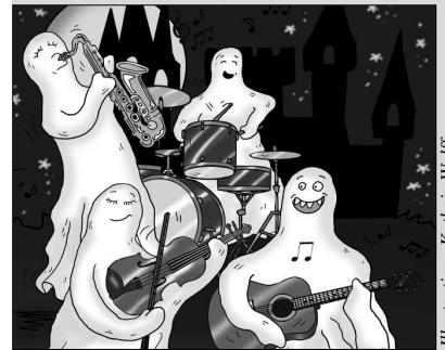
Illustration: Kathrin Wolff