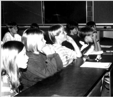
Für Musikunterricht werben – Seite 4