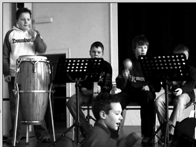
Komponieren in der Schule – Seite 10