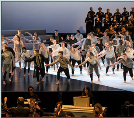
Zu einem schillernden Phänomen heutiger Schulrealität – S. 4