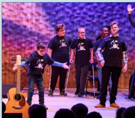
Mehr als 20 Jahre „Live Music Now“ – S. 10