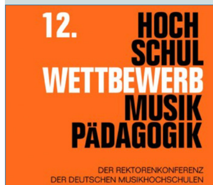
Der Hochschulwettbewerb Musikpädagogik der RKM – S. 50