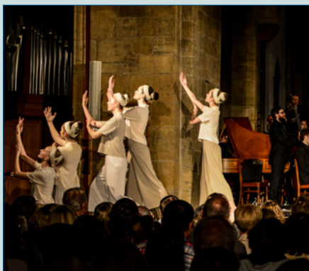
Kooperative Musiktheaterarbeit eines Kultur- gymnasiums – S. 14