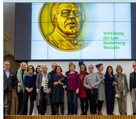
Verleihung der Leo-Kestenberg-Medaille – S. 28