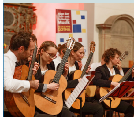
BMCO – Der Dachverband der Amateurmusik in Deutschland – S. 48