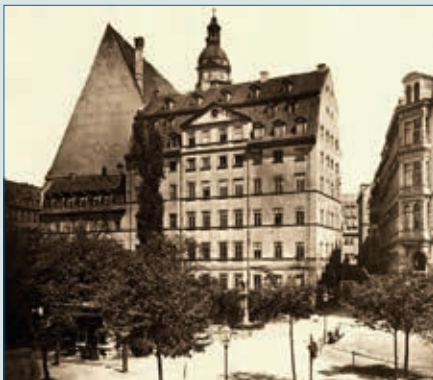
Johann Sebastian Bach: Director Musices, Cantor und Schulmann? – S. 13