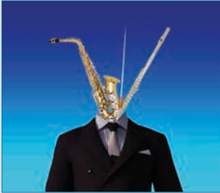
Ein Workshop in fünf Projektbausteinen – S. 4