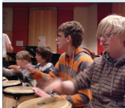
Musikunterricht aus Elternsicht – S. 42