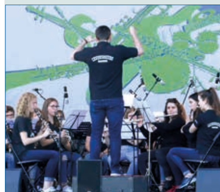
Schulische Ensembles (hier bei Schulen musizieren) sind durch Corona in Not geraten – S. 33