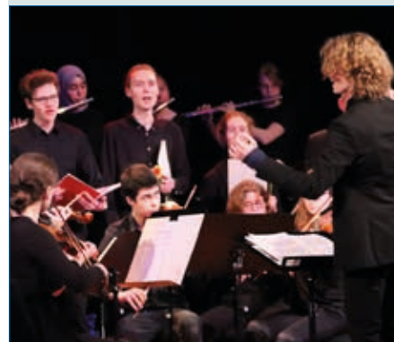
Zur Förderung und Rekrutierung zukünftiger Musiklehrkräfte – S. 30