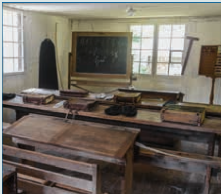
Musikunterricht früher und heute – S. 10