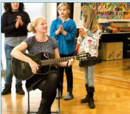
Der beste Job der Welt!? – S. 23