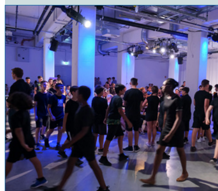
Das Netzwerk Junge Ohren – S. 40