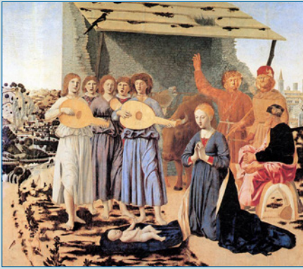
Methodenbausteine zu einer Unterrichtsperformance im pianissimo – S. 4