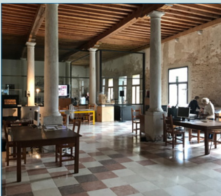
„Fragmente – Stille, An Diotima“ von Luigi Nono im Jahr 2020 – S. 8