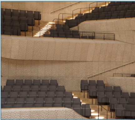
Musik (in) der Kunstpause: The Sound of Silence – S. 12