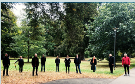
Politische Arbeit des BMU in Coronazeiten – S. 20