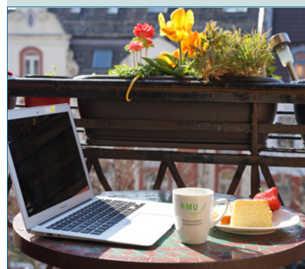
Die Zeit der Schulschließungen und des Hybridunterrichts – S. 34