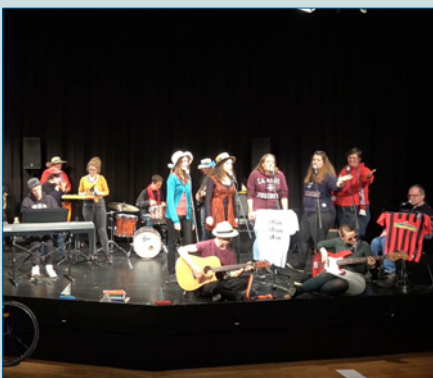
Musikunterricht in gesellschaftlicher Verantwortung – S. 19