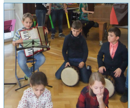
Kein Musikunterricht im Land der Musik? – S. 50