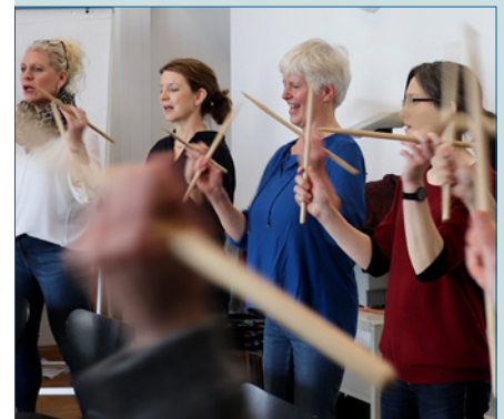
„Immer glücklich schauen beim Rhythmus spielen“ – S. 39