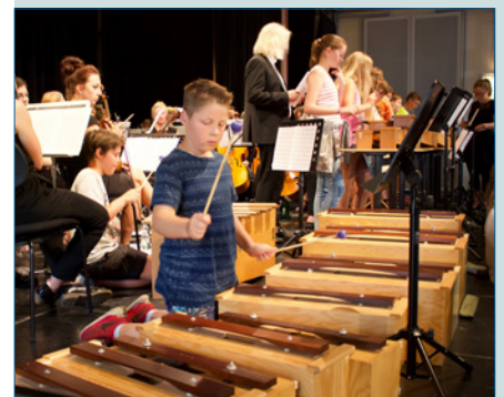
Erlebnis Sinfonieorchester – S. 44