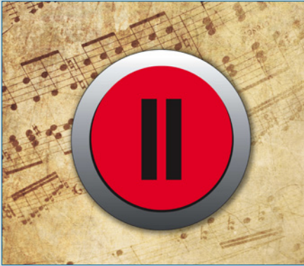
Reifeprüfung: Pausa generalis – S. 4