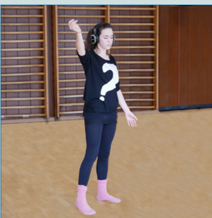
Mit dem Phänomen der Silent Party spielen – S. 24