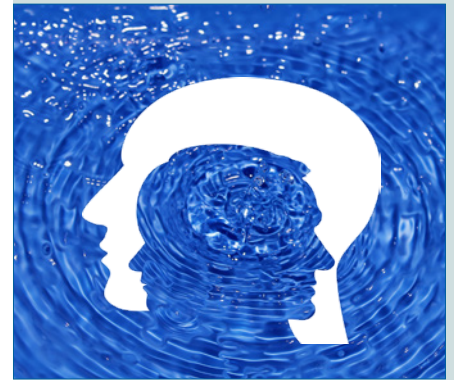
Resonanz am Zug! – S. 28