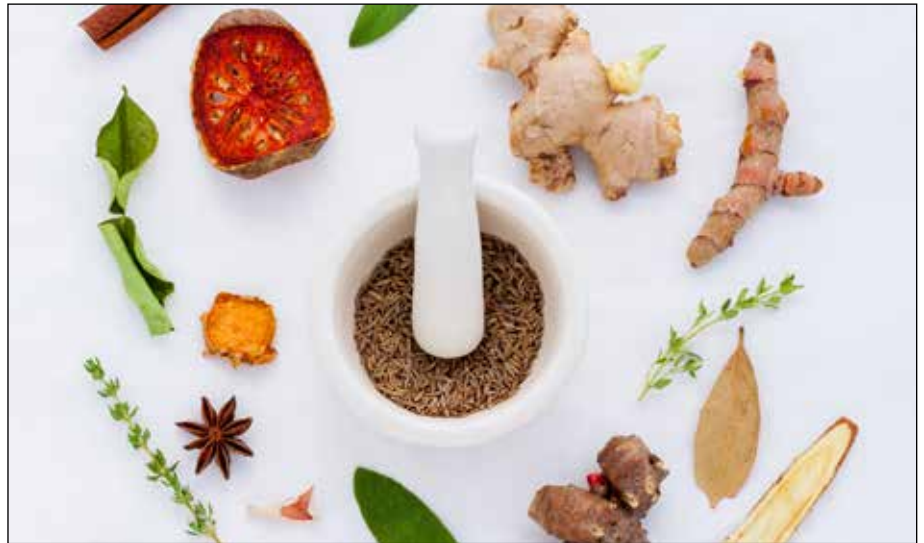
Thema dieser Ausgabe: Lehramt Musik – Gesundheitsrisiken und Vorsorge