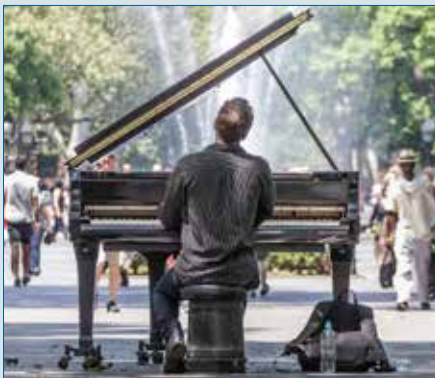
Über Wirkungen und Nebenwirkungen der Musik und des Musizierens – S. 13