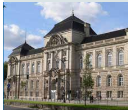
UdK Berlin 100 Jahre nach Kestenberg – S. 22