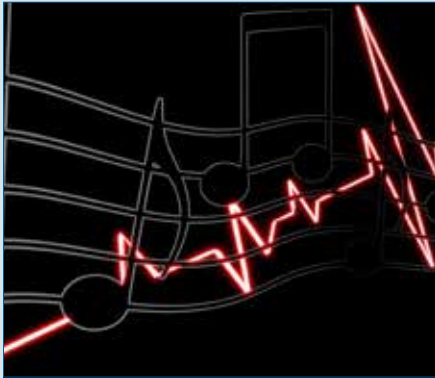
Gesundheit im Musiklehrberuf – S. 4