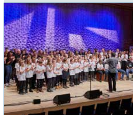
Bundesbegegnung „Schulen musizieren“ in der Elbphilharmonie – S. 24