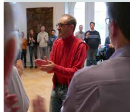
1. Musikpädagogischer Tag in Ostwestfalen-Lippe – S. 26