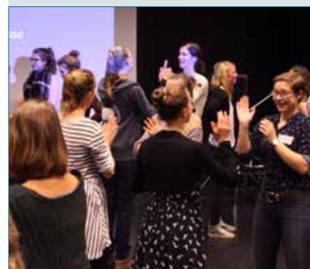
Das Junge Forum Musikunterricht Hamburg – S. 30