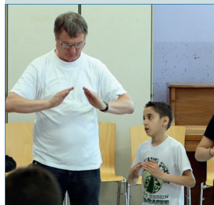
Portrait der GGS Sandstraße in Duisburg – S. 40