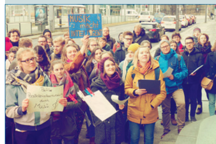
Singen für Bildung – S. 44