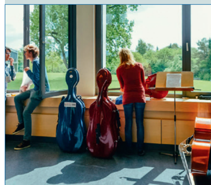
Die Bundesakademie Trossingen – S. 38