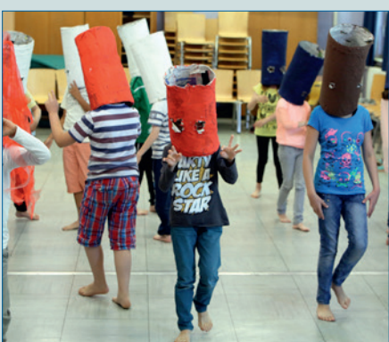
Die Vermittlungsplattform des Klavier-Festivals Ruhr – S. 8