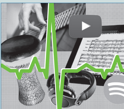
Am Puls der Zeit – S. 14