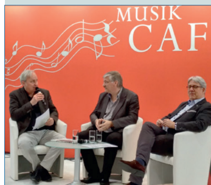
Der BMU auf der Leipziger Buchmesse – S. 34