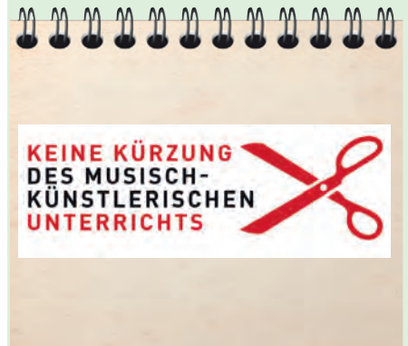
Initiative „Offener Brief“ – S. 29