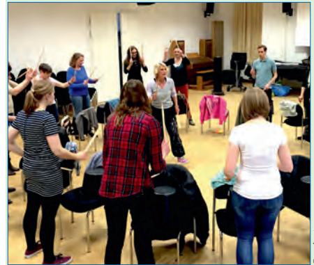
Musikpädagogischer Tag in Niedersachsen – S. 30