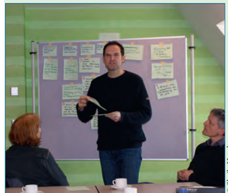
Ideenwerkstatt – S. 37