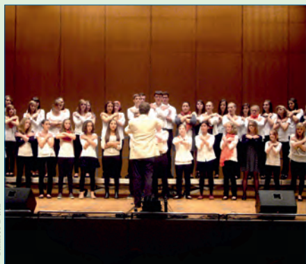
Was für Musikstudierende brauchen wir? – S. 22